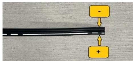
Detalle Cable 12V

NO conectar la alimentación del equipo al tacómetro o reloj de RPM ni a la instalación eléctrica que alimenta la bobina de encendido.