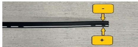
Detalle Cable 12V

NO conectar la alimentación del equipo al tacómetro o reloj de RPM ni a la instalación eléctrica que alimenta la bobina de encendido. NO colocar el equipo cerca de la bobina de encendido o cables de bujías.